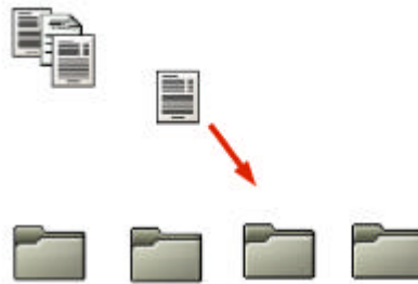
Figure 1: Fig. 1 Clasificación Supervisada

Aunque hay gran cantidad de algoritmos capaces de hacer clasificación supervisada, la idea o enfoque básico es muy parecido: conseguir, de alguna manera, construir un patrón representativo de cada una de las clases o categorías; y aplicar alguna función que permita estimar el parecido o similitud entre el documento a clasificar y cada uno de los patrones de las categorías [6]. El patrón más parecido al documento es el que nos indica a qué clase debemos asignar ese documento.